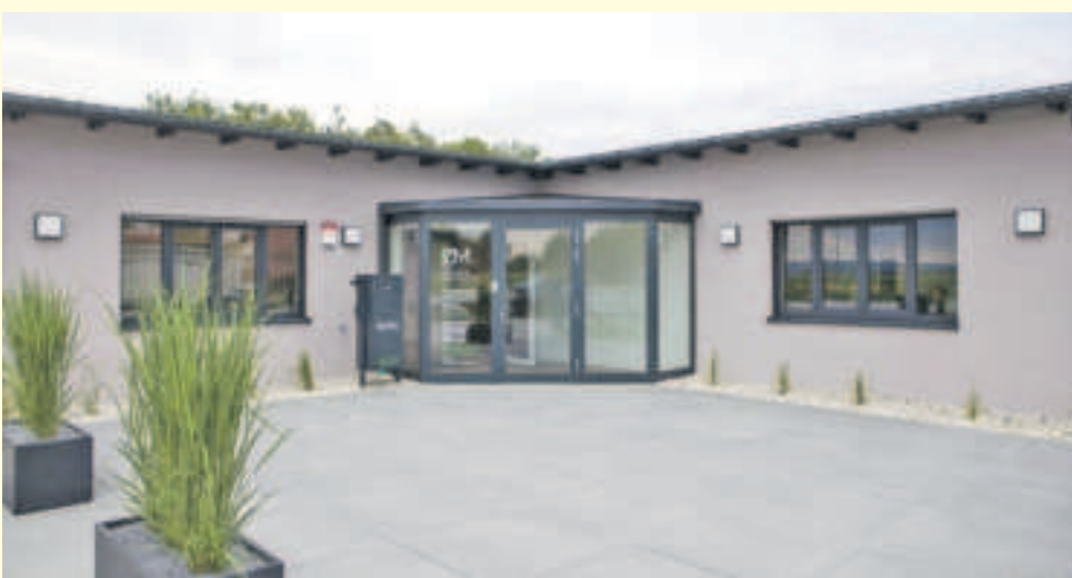
Die neue Steuerkanzlei hat ihren Betrieb bereits aufgenommen.