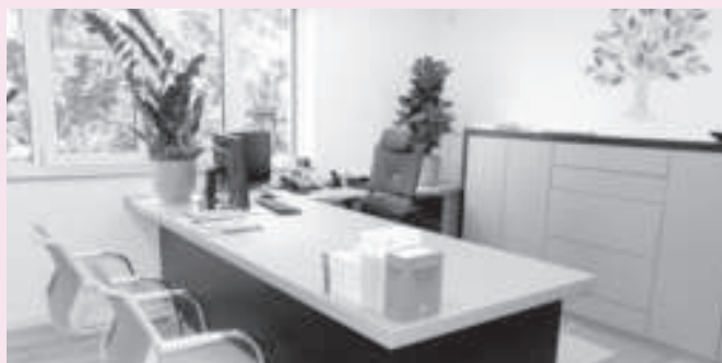
Blick in den Eingangsbereich/Empfang und die Büroräume.